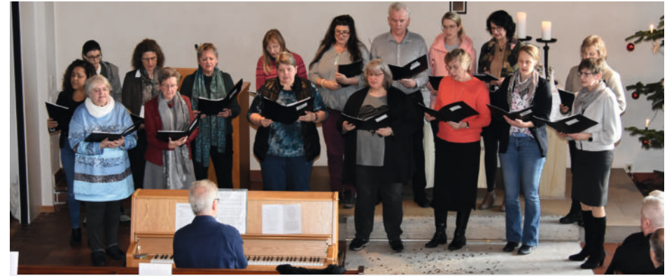
Der Singkreis „grenzenlos“