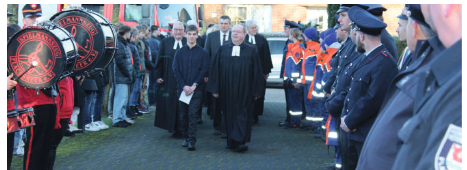
Einzug durch das Spalier vor der Kirche