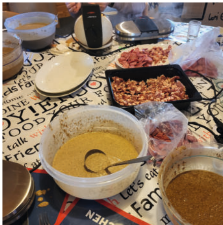
...viele Zutaten

werden gemeinsame Gottesdienste veranstaltet. In den jeweils anderen Gemeinden fallen dann die Gottesdienste aus.