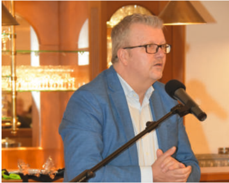
Bürgermeister Theo Douwes