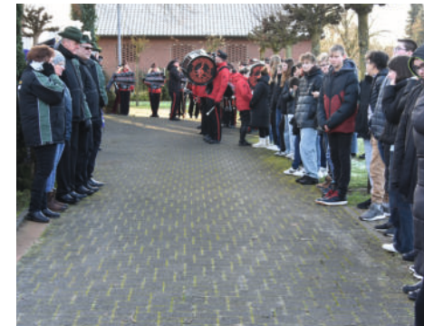
Spalier vor der Kirche