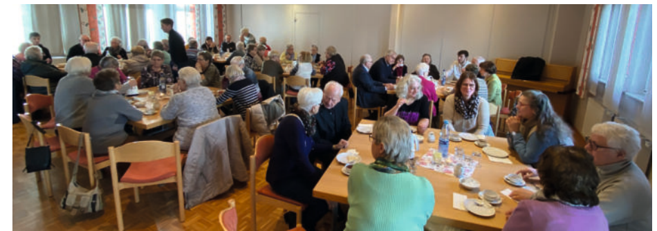
Der Gemeindesaal war voll.