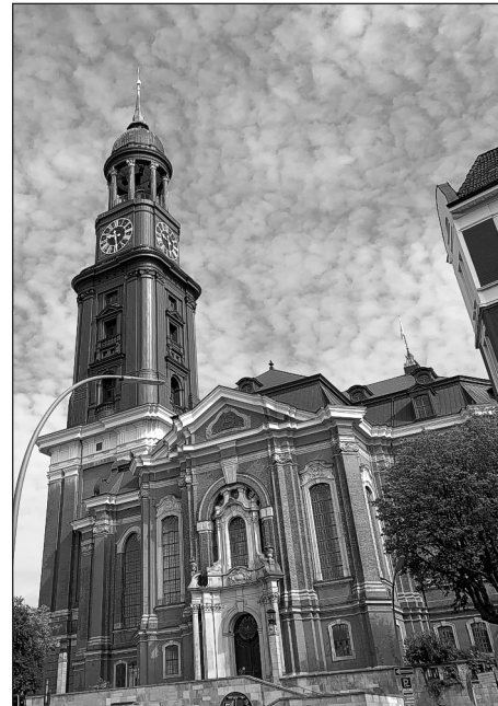
Der Hamburger Michel

Am Sonntag Exaudi am 2. Juni war ich anlässlich eines Kongresses, zu dem ich mich mehrere Tage in Hamburg aufhielt, zusammen mit einer Freundin aus Ihren zum Sonntagsgottesdienst im Hamburger Michel.