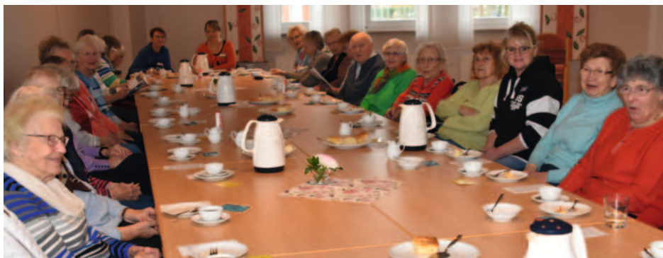
Der Tisch war voll besetzt...

Senioren treffen auf Senioren der Tagespflege „Hof Janssen“